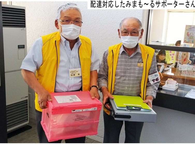
配達対応したみまもるサポーターさん

を、自宅にお届けする事業です。 町内店舗で食料品や生活用品を買った後に、自宅まで持ち帰る事が大変な方をお手伝いします。 現在配達には、高齢者安否確認事業もまもる君のサポーターさんと、社協職員が対応しています。 利用可能な店舗には下記の目印が付いています。 重たい荷物を持ち運ぶことが難しい方、高齢者だけでなく、障がいのある方や妊産婦、病弱な方等も利用することが出